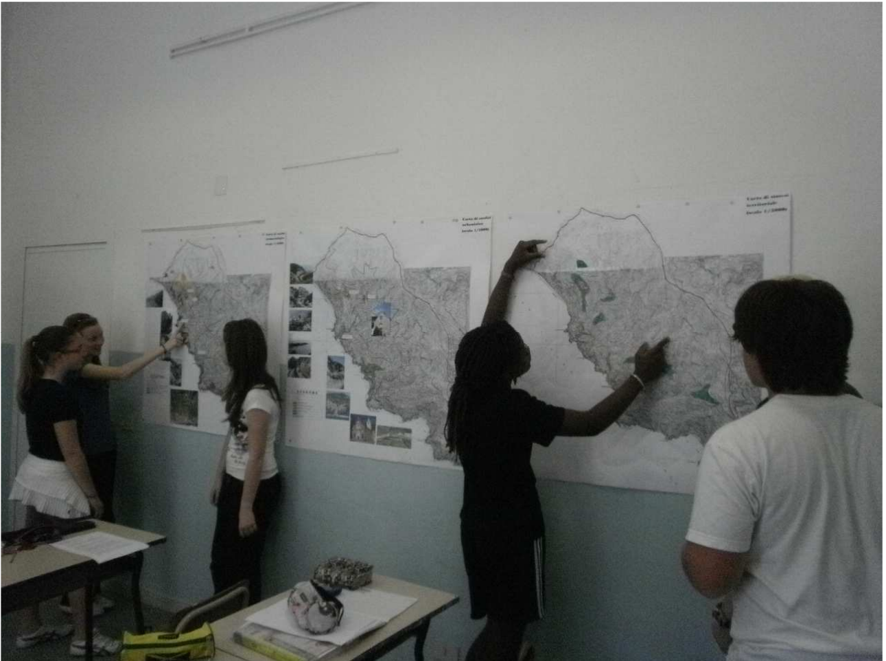
Illustrazione delle carte Riomaggiore, giugno 2010