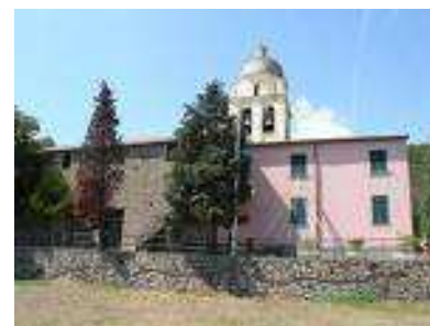
Santuario N.S. della Salute (Volastra)